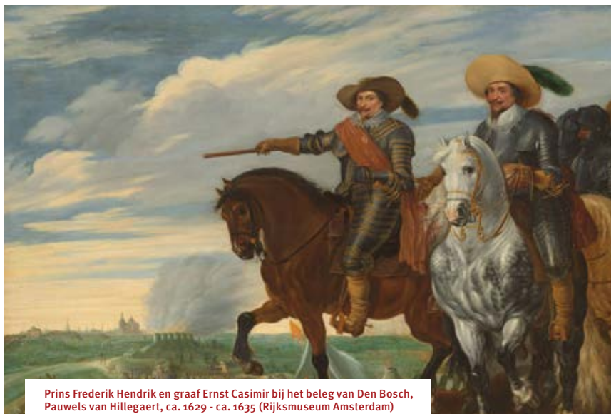
Prins Frederik Hendrik en graaf Ernst Casimir bij het beleg van Den Bosch, Pauwels van Hillegaert, ca. 1629 - ca. 1635 (Rijksmuseum Amsterdam)

Vanaf het begin van de Tachtigjarige Oorlog (1568 – 1648) was 's-Hertogenbosch in handen van de Spanjaarden. Het was een machtige vestingstad, omringd door water en drassig terrein. Tijdens het Twaalfjarig Bestand (1609 – 1621) ontwikkelde de stad zich tot een nog formidabelere vesting, met de aanleg van 7 bastions, 2 forten en een kruithuis. Dankzij deze versterkingen was de stad te midden van de wijde watervlakte ongenaakbaar.