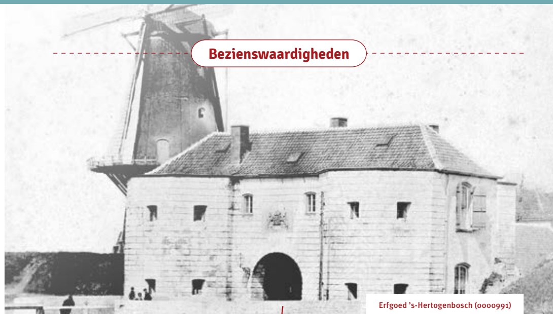
Erfgoed 's-Hertogenbosch (0000991)